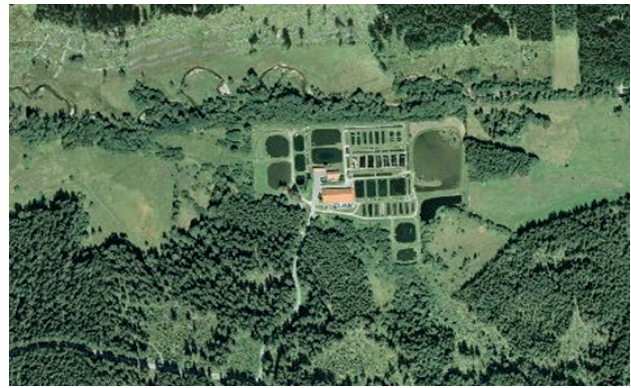
Abb. 3 - Luftbild / Orthophoto

Übrigens ist auch bei der Privat- und Unterrichtskopie eine Vergütung an die Urheber vorgeschrieben, die über die Geräteabgabe auf Drucker und Kopierer pauschal bezahlt und über Verwertungsgesellschaften verteilt wird.