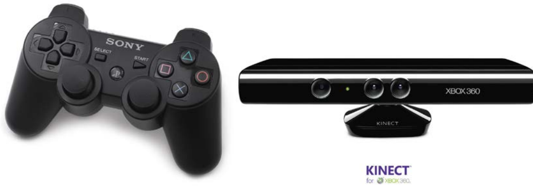
Abb. 2: Playstation3 Gamepad Dualshock3 (links) und XBox360 NUI Kinect (rechts)