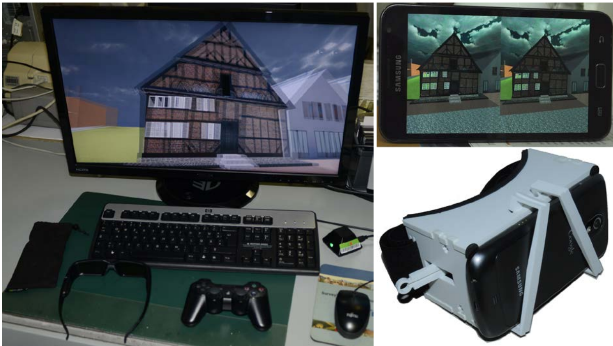
Abb. 4: 3D-Monitor mit Visualisierung durch Nvidia 3D Vision (links) und Smartphone mit stereoskopischen Bildpaar in einer Halterung als Virtual-Reality-Brille (rechts)