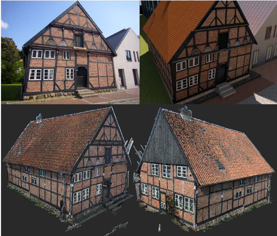
Abb. 1: Alt-Segeberger Bürgerhaus – Foto der Frontfassade (links oben), texturiertes 3D-Modell (rechts oben) und RGB-Punktwolke (unten)